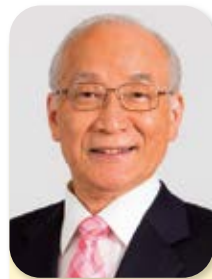
副会長 Vice Chairman