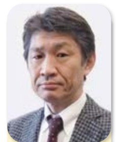
副会長 Vice Chairman