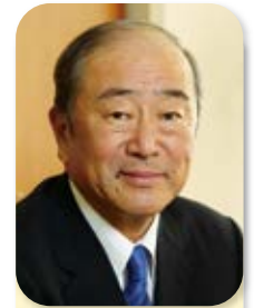
副会長 Vice Chairman