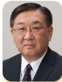
副会長 Vice Chairman