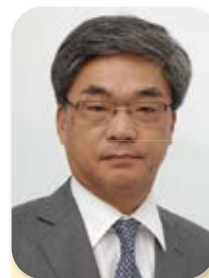
事務局長 Secretary General