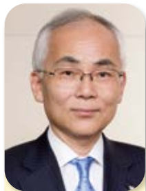
副会長 Vice Chairman