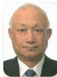
副会長 Vice Chairman