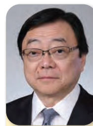
副会長 Vice Chairman