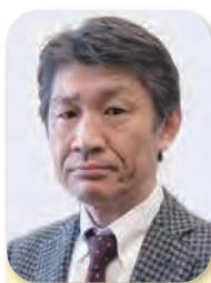
副会長 Vice Chairman