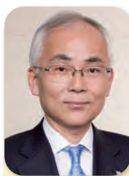
副会長 Vice Chairman