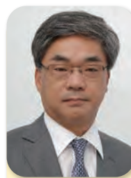
事務局長 Secretary General