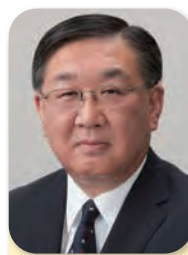
副会長 Vice Chairman