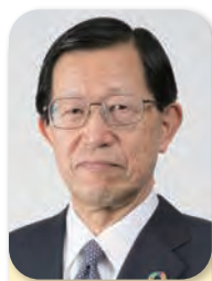
副会長 Vice Chairman