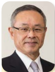
副会長 Vice Chairman