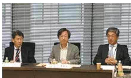
2018年開催の第32回日本国内委員会技術委員会の様子