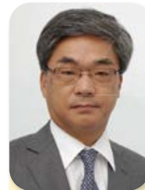
事務局長 Secretary General