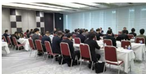
2018年開催 定時総会の様子